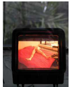
Enna Chaton, in love , la Vitrine de la Villa Saint-Clair, Sète, 2001