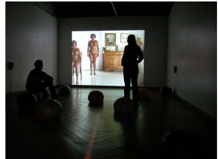
Enna, situation L , Enna Chaton, Laurent Moriceau Association Image/imatge, Orthez et École des Beaux Arts et de Communication de Pau 2004