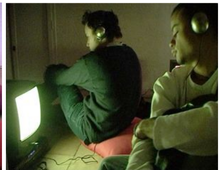
Installation Propos, titre provisoire , Exposition Frappez avant d'entrer Association Carbone 14, Montpellier