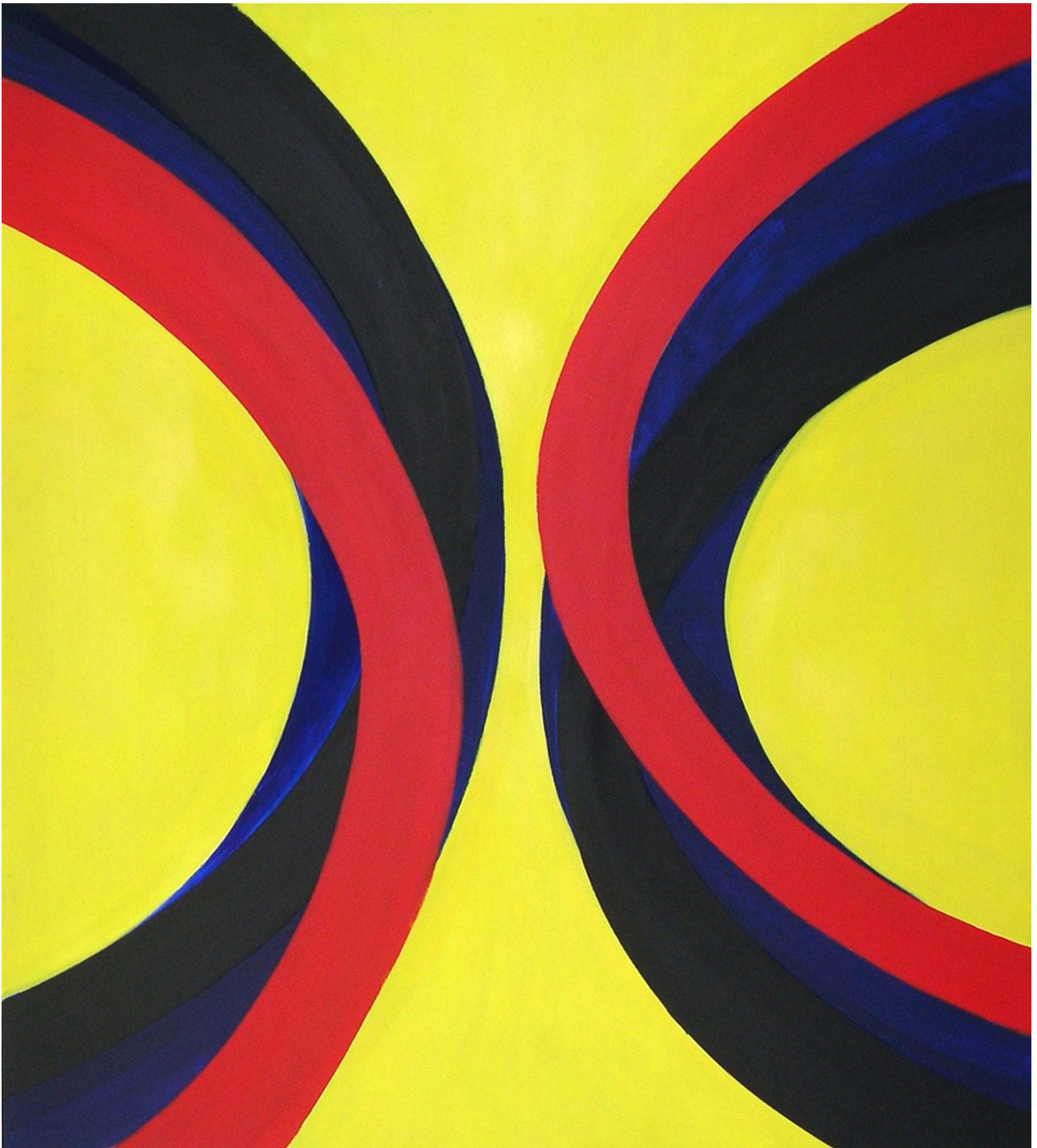
Sans Titre , 180x160 cm, 1995