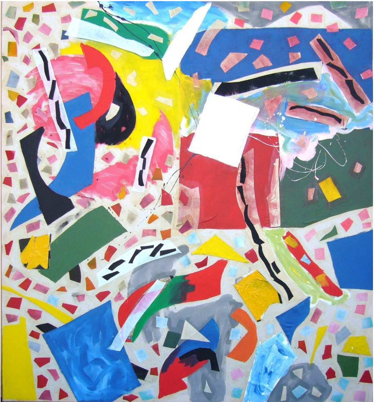
Sans Titre , collage huile sur toile et acrylique, 210x200 cm, 1982